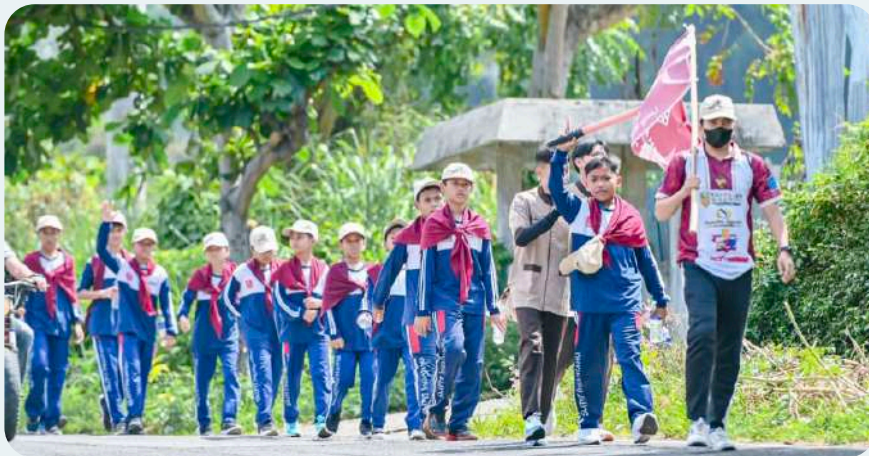
Leadership Management Training (LMT) 2 SMPIT Insantama Bandar Lampung.