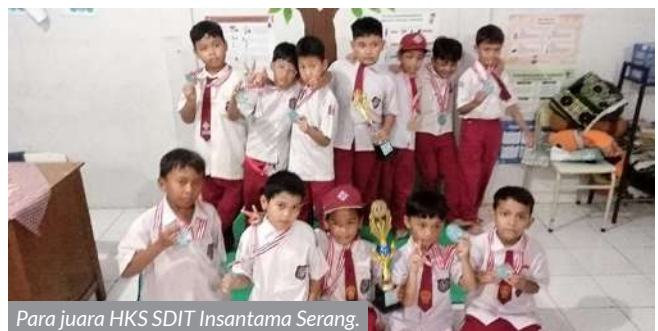
Para juara HKS SDIT Insantama Serang.

seluruh siswa kembali berkumpul di lapangan dan auditorium. Tim merah dan tim putih saling meneriakkan yel-yel dengan penuh energi. “Merah! Merah! Merah!” beradu seru dengan “Putih! Putih! Putih!” sampai suara mereka menggema di sekeliling sekolah. Ketika pemenang diumumkan, tidak ada wajah kecewa, yang ada hanyalah tepuk tangan, senyum, dan pelukan kecil antar teman. Para siswa merayakan keberhasilan sebagai satu keluarga besar.