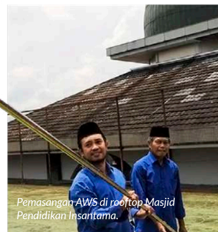
Pemasangan AWS di rooftop Masjid Pendidikan Insantama.