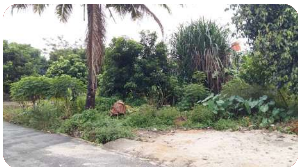
Sebelum menjadi gedung SIT Insantama Pangkalpinang.