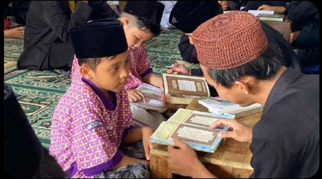
Kegiatan Mabrit kelas 3 SDIT Insantama Bandar Lampung.

Bagi siswa kelas 1 SDIT Insantama Pontianak, Mabrit ini adalah pengalaman