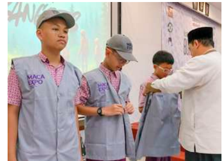
Penyematan atribut Max Ranger kepada tiga angkatan SMPIT Insantama Bogor.