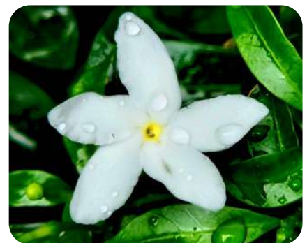
Foto makro, hasil karya Helga Wijaya pada sesi pengarahan fotografi Klub Bahasa.

Saat sesi penjurian tiba, karya makro Ega menonjol. Foto itu dianggap paling detail, jujur, dan tajam melebihi usianya.