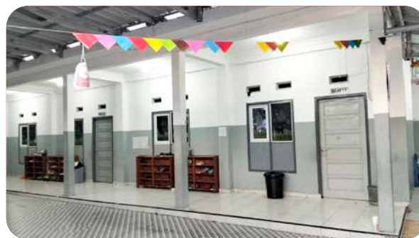
Gedung SIT Insantama Pangkalpinang saat ini.