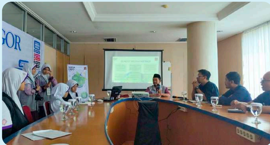
Tim audiensi MacaExpo SMPIT Insantama Bogor menyampaikan materi di hadapan tim Radar Bogor.

Program Bogorku Bersih adalah bentuk kontribusi Radar Bogor dalam mendukung Piala Adipura, piala di ajang nasional terkait kebersihan dan ketertiban kota. Makanya, ketika siswa Insantama menampilkan gagasan pelestarian lingkungan dari sudut pandang literasi, pihak Radar Bogor merasa menemukan mitra muda yang relevan dan visioner.