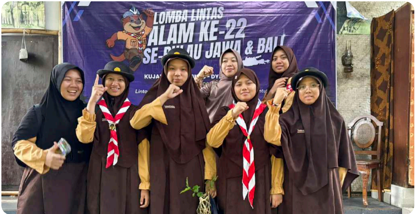
Perwakilan SMAIT Insantama Bogor dalam event Lomba Lintas Alam ke-22 Se-pulau Jawa dan Bali.

menara kayu, dengan tangga dari tali menjulang ke langit. Panitia sempat saling pandang, ragu melintas di wajah mereka.