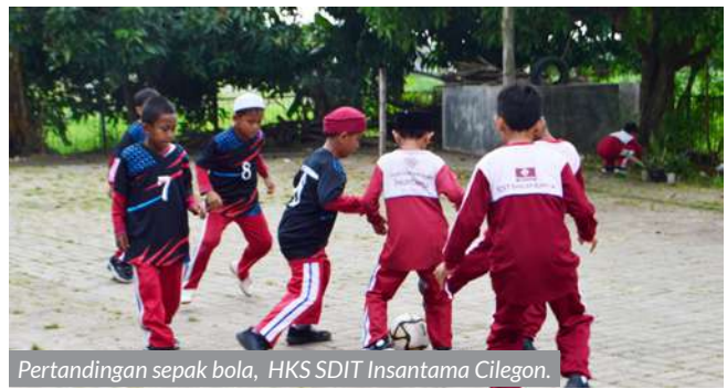
Pertandingan sepak bola, HKS SDIT Insantama Cilegon.