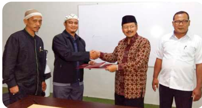
Momen penandatanganan akad kerja sama dengan Yayasan Insantama Cendekia, 2017.