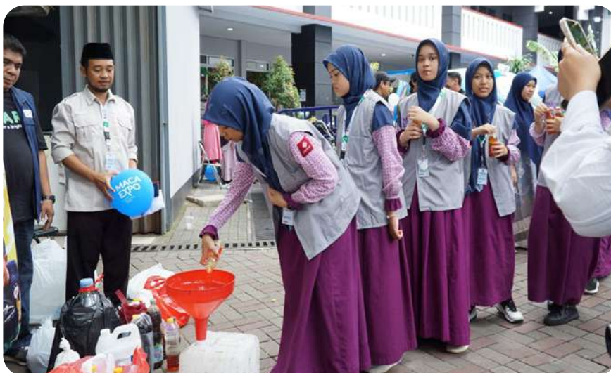
Penyerahan donasi jelantah oleh siswa untuk dijadikan biodiesel.

Di tengah pameran literasi, tawa, percakapan, dan interaksi hangat antara siswa, orang tua, dan pengunjung menambah semarak kegiatan. Stan donasi jelantah menjadi simbol bahwa setiap aksi kecil dapat menjadi berkah. Hidayatul Gusra menegaskan, “Dengan pengelolaan yang tepat, jelantah yang dianggap limbah bisa menjadi berkah.”[] Azka