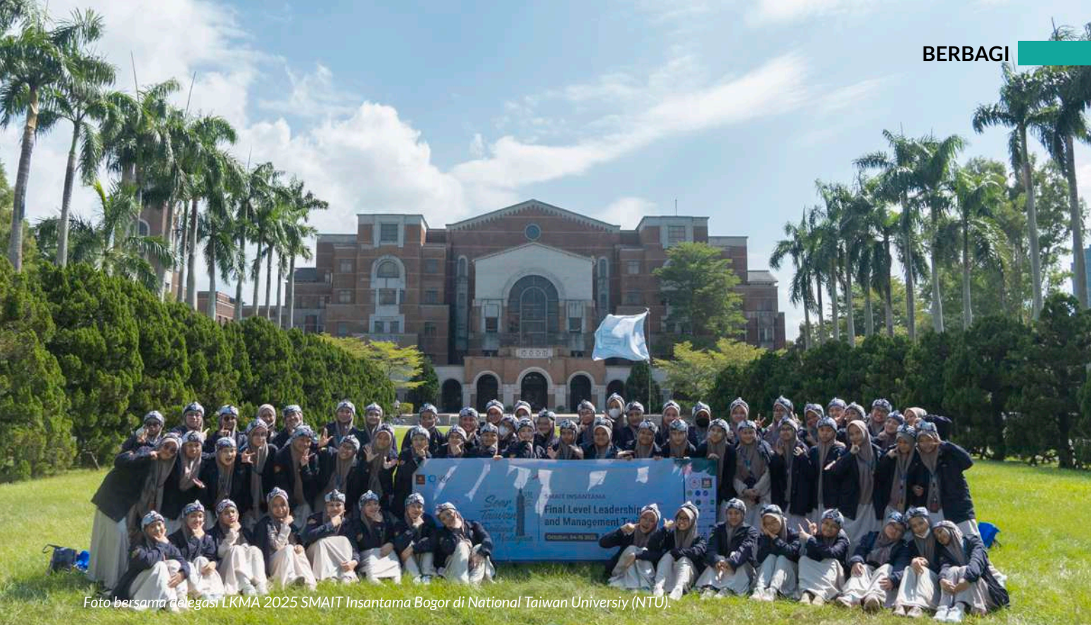
Foto bersama delegasi LKMA 2025 SMAIT Insantama Bogor di National Taiwan University (NTU).