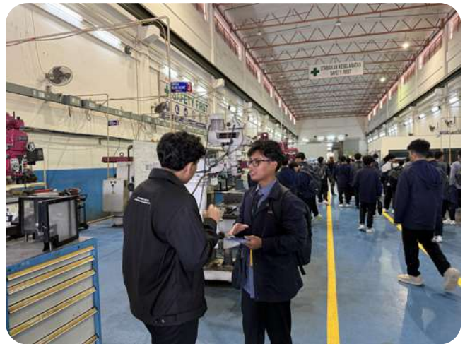
Delegasi LKMA mengunjungi area workshop Universiti Kuala Lumpur - Malaysian Spanish Institute (UniKL MSI).

Ia melanjutkan, "Keinginan untuk nyantri itu masih ada sampai sekarang. Dan dalam kegalauan saya dengan istri, tiba-tiba ada yang menarik perhatian kami saat di Bandara Soetta. Waktu itu, kalau tidak salah sekitar bulan November, saya dan istri akan terbang ke Malaysia menghadiri wisuda anak kami.