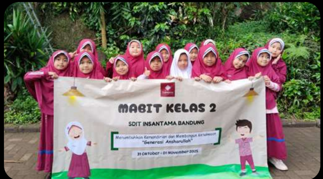
Kegiatan Mabrit kelas 2 SDIT Insantama Bandung.

pertama jauh dari orang tua, Sabtu (31/10/2025). Mandi sendiri, melipat baju, mencuci piring, hal-hal sederhana yang berubah menjadi tonggak kemandirian.